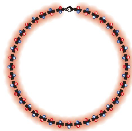
磁石配置 イメージ図